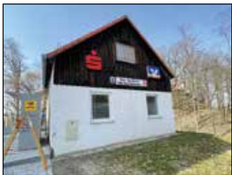
Bestellterminal im Gebäude „Alte Kanzlei“, neben der Kranzberger Bücherei.

E-Rezepte einlösen, Papierrezepte einwerfen und Medikamente bestellen – das geht ganz einfach am Bestellterminal, das die Götz Apotheke in Kranzberg in der „Alten Kanzlei“ neben der Bücherei in der Kirchbergstraße 8a eingerichtet hat.