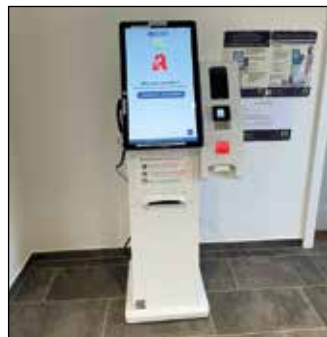
Einfach zu bedienen - Bestellterminal der Götz Apotheke

Zum Einlösen der Rezepte muss lediglich die Versichertenkarte eingesteckt werden. Papierrezepte können in den gekennzeichneten Einwurfschlitz geworfen werden. Über den bedienerfreundlichen Touch Screen lassen sich weitere Medikamente auswählen. Die Bezahlung kann bequem im Nachgang per Rechnung erfolgen. Die Medikamente können in der Götz Apotheke Fahrenzhausen abgeholt, wahlweise auch nach Hause geliefert werden (kostenlos im Umkreis von 10 km, Lieferpauschale für Medikamente ohne Rezept 4,99 €, ab 40 Euro Bestellwert kostenfrei). Die Götz Apotheke leistet damit einen wichtigen Beitrag, dass Bürgerinnen und Bürger ohne eigene Apotheke am Ort trotzdem Zugang zu den Leistungen einer Apotheke ha-