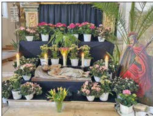
Das Heilige Grab in der Pfarrkirche St. Quirin in Kranzberg

Das stimmungsvolle Ensemble und die farbige Kulisse laden ein zum Verweilen im Gebet und zur Besinnung. Das Heilige Grab soll weiterhin die Bedeutung über das eigene Sterben und den Tod versinnbildlichen.