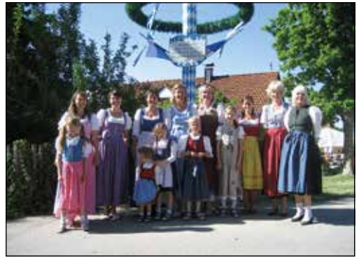
Die Frauen der Berger Dorfgemeinschaft 2007