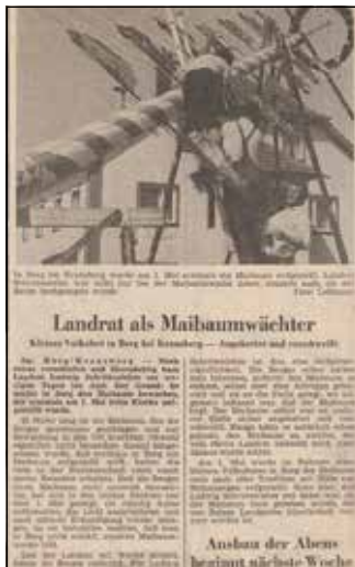
Zeitungsartikel aus dem Jahr 1976 mit dem Bericht zum ersten Berger Maibaum

Die Berger hatten ihren ersten Baum gut versteckt und zusätzlich eine Falle ausgelegt, die genauso gewissenhaft bewacht wurde. Es kam zu keinen nennenswerten Zwischenfällen. Im Rahmen der Brauchtumspflege