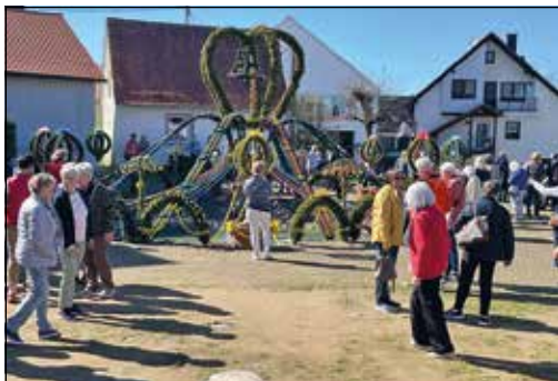
Osterbrunnen in Bieberbach

Der „Club der Reiselustigen“ unternahm am Dienstag (ausnahmsweise), den 07.04.2026 seine erste Tagesfahrt im Jahr 2026 . Es ging in die Stadt Forchheim und zur Osterbrunnen-Rundfahrt im Landkreis Forchheim , bei der man öfters mal ausstieg, um die Brunnen genau zu betrachten und das eine oder andere Foto zu „schießen“. Zuletzt kam man in Bieberbach an. Dieser Osterbrunnen ist etwas ganz Besonderes. Nicht umsonst brachte es dieser in das Guinnessbuch der Rekorde.